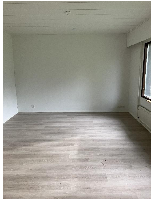
Olohuone kuva 1