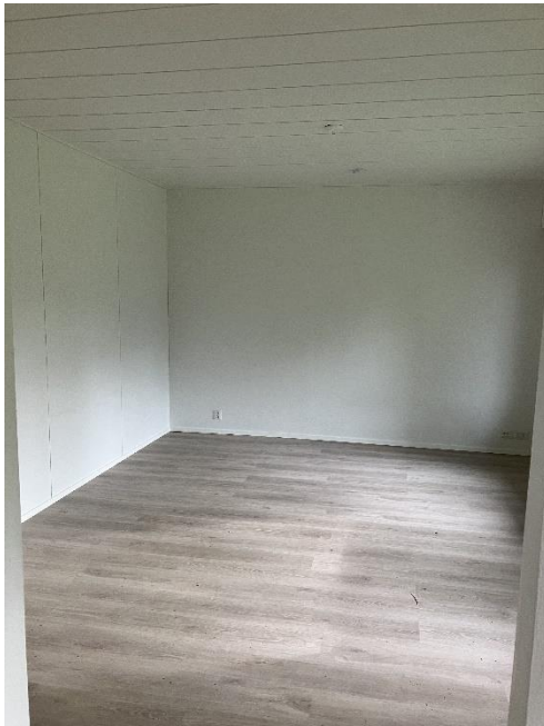
Olohuone kuva 2